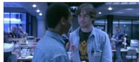
Та самая футболка