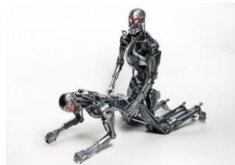
Правило 34 же

атакующая боевая единица. Что-то вроде кибер-SS. На русском языке фильм расово верно назывался бы «Ликвидатор», но, видимо, потому, что это слово у нас означает сотрудника спасательной службы и не несёт негативный оттенок, вариант не прошёл. К тому же, в этой стране кинопрокат «Терминатора» начался лишь в 1991 году , когда зрители уже успели привыкнуть к VHS-традиции перевода — ведь могли и «Киборга-убийцу» перенять... А ещё в мохнатом 1980-м г. Терминатором (с большой буквы) звался персонаж вселенной DC Comics — Deathstroke, позже хоть и сохранивший в имени это слово, но известный всё же не под ним.