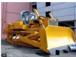
T-800, альфа-версия терминатора.