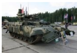
Военный терминатор с белковым процессором.