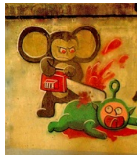
Расово верный рисунок

Ну а самые гадкие ублюдки среди телевизионщиков — это конечно же авторы телепузиков. Вот чьи генеталии надо нещадно прижигать раскаленной кочергой, ибо их омерзительное, тлетворное влияние на детей является страшнейшим преступлением против человечества. По ходу телепузики — это гнусный пиар-проект инопланетных захватчиков , которые хотят превратить мозги землян в