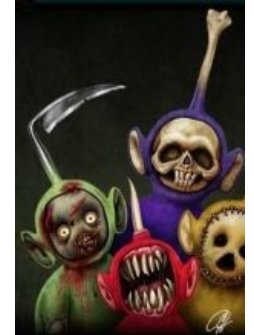
На самом деле

Вариант 3. Телепузики колонизируют другую планету, или колонизировали, но прошло так много времени, что они забыли... короче, ремейк «Пасынков Вселенной».