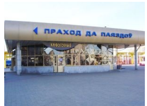
«Да паяздоў» — кошмар тарашкевиста.