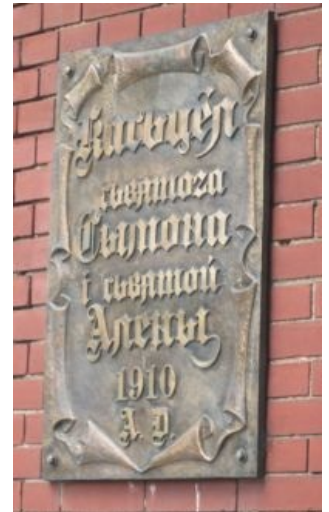
Надпись тарашкевицей на Красном костёле на центральной площади Минска. И никто не снимает.