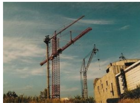
Колыбель Республики KaZантип

В 1986 в Чернобыле ебнуло , и строители задумались. Думали они три года, и в 1989 году строительство окончательно заморозили. Местные жители поговаривают об опасениях строителей, что их детище постигнет участь ЧАЭС — якобы под будущей станцией обнаружили портал в Адъ тектонический разлом. Но педивикия намекает , что это были лишь отмазки верхушки власти, ибо им тогда было не до мега-строек.