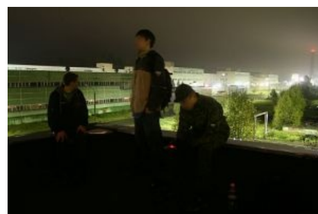
на забросе в действующем объекте