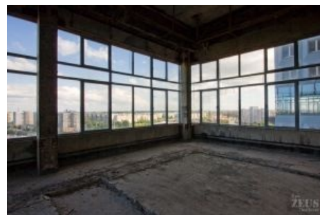
Вид с 11-ого этажа на город