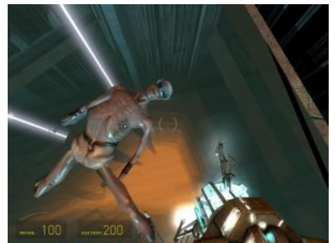
Во второй Халве