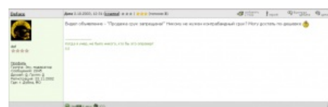
Первое зарегистрированное появление

Срук — слово, фактически появившееся удалением пробела с истинного русского выражения с рук . Получившееся, по восприятию многих, существительное, а по факту объект негодования граммарици , воспринимается некоторыми как возможность пофлудить в пространство различными лучами с целью получения лулзов, что не всегда удаётся по причине бородатости русского языка и очевидности трансформации. Как следствие, попытки получения лулзов легко перетекают в стадию распространения УГ .