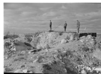
ДОТ Sj-4 Западный каземат

И на то имелись свои основания, так как РККА впервые встретила необычную компоновку финских дотов, когда в сторону противника обращена глухая замаскированная стена, а наступающую между холмиков пехоту внезапно поражает фланговый огонь, выкашивает её всю, и даже некому ткнуть пальцем в сторону, откуда прилетел свинец. Вот так на хитрый финский попец нашелся свой скульптор с винтом.