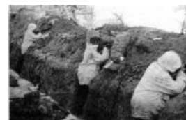
Кое-где линия выглядела так

Эта войнушка была очередной лишь с той разницей, что впервые за все 8 раз СССР напал на Финляндию. Но сначала финнам предложили по-хорошему обменять этот стратегически вкусный с военной точки зрения кусок их территории на вдвое бóльший по размерам кусок советской территории, на которую они все 20 лет ходили войной, дабы те подтерли слюни и с поцреотической честью ушли осваивать гешефт. Финны же посмотрели на свое население на запрошенной территории (изрядно), на