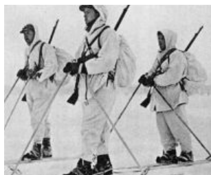
Норвежские биатлонисты готовы к выступлению за сборную Финляндии

27 декабря Мерецков обратился к начальнику Генштаба Шапошникову, сказав, что финны подготовились и молодцы, а мы — русские распиздяи, и нам нужна тяжелая артиллерия, а вот танков не надо. Весь январь, построив макеты ДОТов, по-быстрому сделав полигоны и наладив лыжную подготовку, красноармейцы готовятся к следующему штурму. Формируется Северо-Западный фронт, резервы подтягиваются, а личный состав дрочится, чтобы в следующий раз все сделать по уму. К слову, как уже говорилось, именно по этим причинам и появляется «линия Маннергейма» как мем, обозначающий неприступную крепость маленького финского народа.