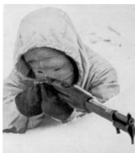
Суровый финский солдат суров [1]

К концу 30-х финны, в знак своего европейского превосходства и гуманизма, закончив строительство кучи дотов [2] с окопами и пулемётами (общей протяжённостью более 90 км), устроили замаскированные укрытия для нападения партизан на мирных советских десантников. ВНЕЗАПНО стали регулярно практиковаться обстрелы советской территории и даже небольшие быстрые рейды с экстерминатусом застав и больниц, плюс нарушения воздушной и морской границ. Терпилы-совки те границы соблюдали и только задерживали финских морячков-браконьеров, среди которых как-то внезапно затесался финский же пограничный катер. На суше совки были не столь безобидны и даже (о, ужас) позволяли себе иногда отстреливаться от финнов. На письма счастья с советской стороны требованиями провести расследования инцидентов финны хранили высокомерное молчание. В общей сложности с начала 20-х до Зимней войны финские солдаты входили в советскую Карелию с туристическими визитами пять раз, что не повышало уровень доверия к ним. А заброска агентов была такой же обыденностью, как и на бывшей польской границе.