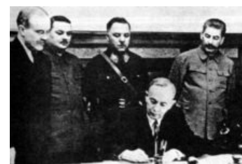
Куусинен. Не выглядит таким страшным.

Уже на второй день войны, когда и до линии Маннергейма-то ещё было далеко, в занятом городке Терийоки (ныне Зеленогорск) было создано «народно-демократическое правительство» во главе с депутатом Верховного Совета СССР товарищем Куусиненом и провозглашена Финляндская демократическая республика. Ничего особенного в такой практике не было, те же финны имели такое же профинское карельское правительство. На следующий же день товарищи Сталин и Молотов подписали с товарищем Куусиненом договор, дав понять, что шутки кончились: правительство в Хельсинки было плохим, негодным, а теперь и вовсе как бы фейковым. Фалломорфировавшим с такой подачи представителям западных держав объяснили, что, мол, оно всё равно уже сбежало в неизвестном направлении, как недавно польское. И если бы дальше война шла по плану , то правительство Куусинена при широкой поддержке трудящихся масс финского народа попросилось бы в состав СССР и шестнадцатая республика простёрлась бы до Ботнического залива. Но — увы и ах! — война пошла не по плану. Кроме того, из карелов и вепсов, которые отличаются от финнов примерно как русские от белорусов, была создана Финская народная армия с символическим названием « Ингерманландия », части которой успели даже принять реальное участие в боях. Однако правительству Куусинена дойти до Хельсинки не помогли и они.