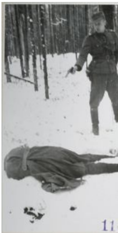
Деление коммуниста на ноль