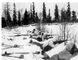
Готовы встретить советских друзей свинцом да картечью