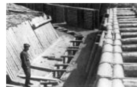
... и противотанковыми рвами

А кое-где были железобетонные доты с вращающимися бронеколпаками