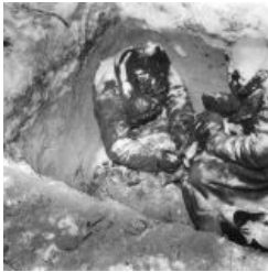
Эскимо из бойцов РККА