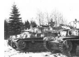
Советское танковое звено

после чего их никто не видел, офицеры нарезали резьбу , не проявляя инициативы, а снаряды всем им не могли подвезти из-за пробок в тылу. Говоря попроще, имея на руках все козыри, РККА играло как лох . Главной причиной был банальный дефицит командиров звена «полк-дивизия», которых не хватало просто потому, что РККА каждый год с 1932 росла как гриб после дождя. Полками командовали майоры, а их заместителями были капитаны, поэтому-то артиллеристы и стреляли не туда, а танки приезжали, когда пехота уже ушла кто в лес, кто по дрова.