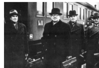
Будущий президент Паасикиви вернулся из Москвы с интересными новостями.

В самой Финляндии мнения разделились. Будущие президенты Пааскиви, а тогда посол, и Маннергейм, которого 17 октября назначили главнокомандующим, сразу заявили, что-де нужно соглашаться на советские условия, но поторговаться по мелочам. Но тогдашняя Финляндия мало чем отличалась по уровню пещерного поцреотизма от современной Уркаины, а газеты принадлежали профессиональному русофобу Эркко, который по совместительству был министром иностранных дел. Поэтому аргументы будущих президентов в массах не заценили, и первым делом посадили всех, кто «разговорами мог подорвать обороноспособность», а себя взбодрили, озвучив в газетах западные обещания. Финны тянули время и вообще считали, что Молотов блефует, а воевать с ними и англичанами засыт (Гермашка уже имела пакт о ненападении ). Англичане же передали в обе стороны взаимоисключающую информацию: финнам, что впишутся, русским, что вписываться не будут. Сверхдержава, чоужтам.