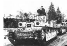
Советский корован не подозревает, что набигаторы не дремлют

Ещё больше она была не готова к тому, что зимой холодно : в шинельках (тулупы полагались только офицерам) и в кирзовых сапогах, без палаток и печек солдаты гибли чаще от обморожений, чем от боевых потерь. К декабрю ценой утопленных дорогуших танков прорыва, обмороженной и выпиленной десантуры удалось превозмочь полосу обеспечения линии и выйти к краю главной обороны. Войска тут же погнали в прорыв с закономерным результатом . Настроение советскому командованию немало испортила операция у озера Толваярви, где финны усилиями одного полка и четырёх батальонов устроили мощный озалуп двадцатитысячной советской дивизии.