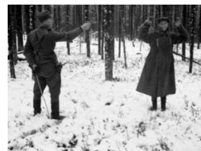
Советский разведчик улыбается в камеру за секунду до расстрела. Восточная Карелия, ноябрь 1942 года

Финны стали укреплять свои позиции фортификационными сооружениями и занялись диверсионными действиями, из которых наиболее успешной [= героической по словам тогдашней пропаганды] была операция уничтожения советской базы снабжения в карельском посёлке Петровский Ям. В 2 часа ночи 12 февраля 1942 года было убито 72 солдата, 28 человека медперсонала, все раненые госпиталя, все заключённые стройки и мирные жители посёлка.