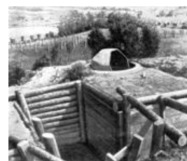
А кое-где были железобетонные доты с вращающимися бронеколпаками