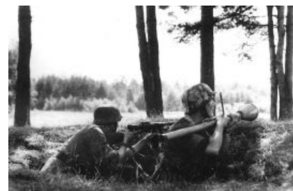
Финские пехотинцы даже не смотрят на тебя

Продолжая играть роль несправедливо контуженных, добровольные пособники нацистов огласили цель уже четвертой за 23 года войны. И как обычно, ею был захват несправедливо отторгнутой Карелии. Маннергейм, которому уже было 74, ныне русский патриот, ненадолго удостоившийся памятной доски в Петербурге, а тогда добровольный пособник нацистов, вспомнил свою клятву «Меч в ножны», мол, я поклялся в 1918 году и вот через 23 года я выполняю своё обещание вернуть Карелию! Рубежи довольно быстро и с минимальными потерями были отодвинуты к «старой границе», после чего некто У. Черчилль написал Маннергейму письмо, в котором вежливо попросил не переходить старую границу 1920 года. Но Маннергейм ответил вежливым отказом . 29 ноября 41-го финский премьер Рангел выступил с докладом, из которого следовало, что финны и немцы братья навек, во всех финских войнах с 20 года виноват СССР, а значит надо его расчленить FGJ . 6 декабря, аккурат в день независимости, финский парламент утверждает границу 1920 года как государственную, и в тот же день им прилетает объявление войны Великобританией. Узнав об этом, финны начали еще активнее обороняться, заняв Петрозаводск, Олонец, Медвежьегорск, Карелию и часть Вологодской области.