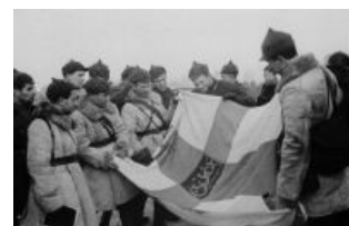
Победители находят флаг Финляндии довольно занятым

Наступление не везде шло ровно, но удар советских войск в направлении Ляхде оказался удачным. В этом месте финны понесли наибольшие потери от артподготовки, и Красной Армии удалось кое-что превозмочь: командованию — «в себе поца» , а простым бойцам — все ужасы суровой финской обороны, которая при надлежащей артподготовке оказалась совсем не суровой, а мягкой и шелковистой. Почти сразу на высоте 65,5, где находился центральный ДОТ, был поднят красный флаг. После этого все всё поняли.