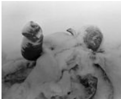
Финская расовая жертва генерала Мороза