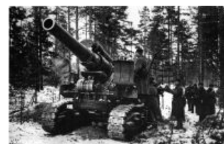
Гаубица Б-4 («Кувалда Сталина» — финское прозвище) готова передать пламенный привет финским товарищам