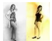
Мини-бикини '69 Две актрисы для сравнения