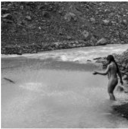
Не она, да...