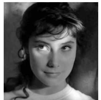
Таня Самойлова — актриса, сорвавшая башню всем Голливудам

Темнеет за окном - Ю. Коваль, И. Саввина Дуэт Ии Савиной и, ВНЕЗАПНО, Юрия Ковалья