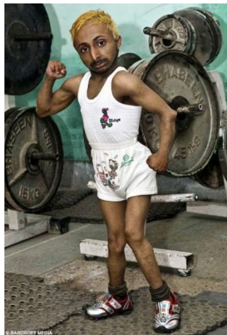
А он нет!!1

— Но я-то знаю! Потому что у нас на кухне зарубки есть, я всегда топором делаю каждые три месяца, где у него там голова.