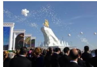
Никого не напоминает?