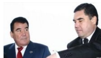
Батя и сын

Родился в 1957 году в обычном туркменском селе . Закончил институт по специальности «стоматолог», работал по профессии, пока его ВНЕЗАПНО не сделали министром здравоохранения Туркмении. Все норм, вон у нас бывший КГБ-шник президентом стал . После того, как стал министром, пошли слухи, что он — сын Ниязова. Этот слух подкрепляли несколько фактов. Во-первых, это внешнее сходство между ними. Во-вторых, он без проблем оставался на посту и министра здравоохранения, и премьер-министра, в то же время как других чиновников меняли один за другим.