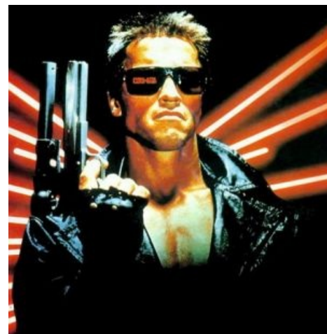
Типичный сервер скайнет (хотя скорее нод , или даже поинт ).