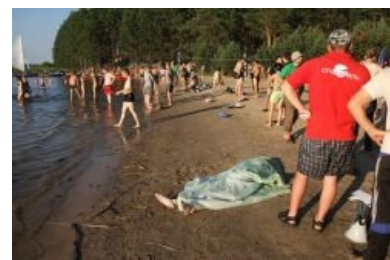
Лора Палмер рекламирует Селигер

Естественно, регулярные собрания подобного рода рано или поздно заканчиваются трагедиями. Так на Селигере-2010 один студент МАИ перекупался и принял ислам — он, желая произвести впечатление на окружающую пиздобратию, попытался сделать сальто в воде, не умея плавать. Итог закономерен , но вы же не думаете, что нашисты настолько брезгливы, чтобы отказаться купаться рядом с трупом , не правда ли? Одна из организаторов заявила, что у пацана был приступ эпилепсии на воде, и в происшедшем виноват он сам, так как привёз поддельную справку о здоровье. После ЧП был оперативно закрыт доступ к социальным сетям и твиттеру в связи с тем, что участники форума начали постить что-то вроде «А у нас утонул парень». Вечером на промывке мозгов о трагедии никто не упомянул, ведущие были бодры и веселы, а после построения была, как и в другие дни, зажигательная дискотека.