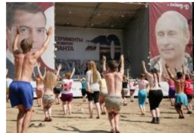
Три раза Ку!

К участию в лагере-форуме привлекаются все подряд, ибо желающих не особо много. В итоге в данном зомбарииуме можно встретить разномастное быдло в возрасте от 16 до дохуя лет, с часто довольно противоположными взглядами на будущее Рашки . Так в лагере одновременно присутствуют ярые участники Путин-югенд, какие-то гопники, футбольные фанаты, православнугые и просто неприкаянные долбоёбы. Данная масса для поддержания порядка группируется в молодежные быдло-дружины, начинающие каждое утро с идеологической обработки: « Наши, тока движение вперед! Наши, и никогда наоборот! ». Данная обработка в топорной а-ля совок манере проводится целый день вперемешку с лекциями, хозработами и организованным выступлением перед телекамерами в качестве массовки. Толстолобость данного семейства видна невооруженным взглядом, ибо особи, почти твёрдо уверенные в том, что именно они решают судьбу страны, увлеченно принимают участие в специальных олимпиадах на тему « Как нам обустроить Россию ».