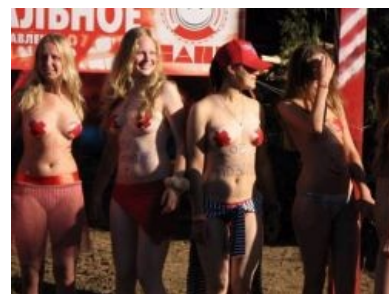
Вероятно, будущие жертвы залёта

Развлечения — кормление комаров, бухло, ебля, да вроде и всё.