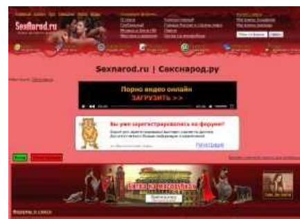
Реклама и Народ

Начинались бурления говн, доверчивые граждане несли сотни нефти, недоверчивые подвергались анальным карам. Справедливые Гадкие и мерзкие вопросы, касающиеся профита с форума, а также внезапного совпадения проблемы с началом сезона отпусков справедливо карались баном.