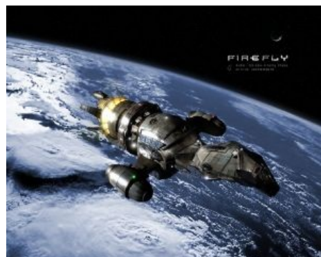
Она самая [1]

Firefly (рус. Светлячок ) — американский sci-fi сериал, рассказывающий об экипаже маленького космического кораблика корыта под названием «Serenity», созданный Джоссом Уидоном и выпущенный FOX в количестве одного скомканного сезона в 2002 году. Является спорным сочетанием вестерна и фантастики, что обычно считается помесью ужа и ежа, но совершенно винрарно в данном случае. Первоначально низкие рейтинги , некассовое время показа, хреновая реклама и показ серий не по порядку (!) заставили телеканал закрыть сериал, не дождавшись конца первого сезона. Есть мнение , что в результате столь раннего закрытия Светлячок не успел скатиться в говно, прочно обосновался в списке наилучших сериалов, оброс толпой фанатов и получил 9.5 по версии IMDB. Фанаты, кстати, настолько бурно бурлили и покупали всякие DVD-издания, что FOX в 2005 году раскрутился на продолжение, позволив Уидону и Universal снять полнометражный фильм Serenity , который в русском прокате прошёл как Миссия Серенити .