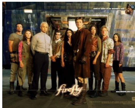
Их мало, но они в тельняшках