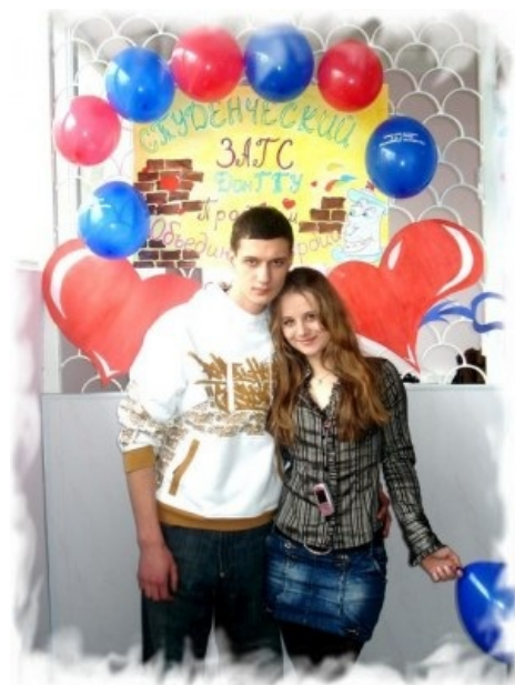
Они не поленились и поженились. А ты все ждёшь 30-летия?

Зачастую два ахтунга, нашедших друг друга, и прожившие совместно месяца 2-3, решаются уподобиться обычным парам и зарегистрировать свои отношения. Они едут в ближайшее место регистрации (жержёвь, администрацию и т. п.), где их окольцовывают. Костюмы обязательно максимально пошлые, дабы никто не мог усомниться в ориентации парочки, а также их гостей. Но в целом мало чем отличается от обычных свадеб.