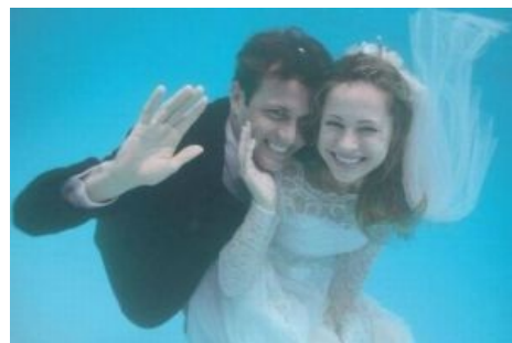
Поплывать не хотите ли?