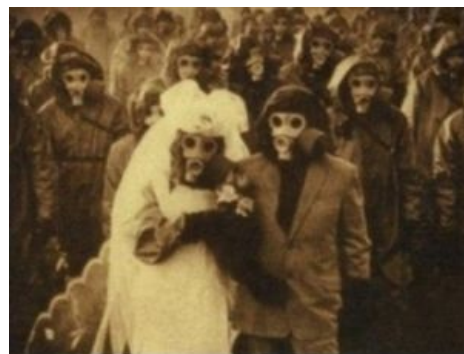
Из-за высокого содержания серных испарений в воздухе на островах Идзу, людям приходилось носить противогазы, что бы выжить.

Данный вид свадеб был распространен в старые добрые времена Совка , когда трахаться до брака считалось некошерным. А трахаться молодым здоровым парням и девкам, естественно, хотелось. Поэтому студенты, особенно те, что проживали в общагах, найдя себе бой-или гёрлфренда, сразу же запиливали свадьбу безо всяких капиталовложений в наряды, обряды и шансонье. В последнее время практикуется редко — ввиду того, что рано жениться теперь как-то не стремятся (добрачный секс больше не порицается, ебацца можно хоть до искр из глаз - было бы где), но даже если детки и хотят пожениться, родители зачастую устраивают «классический вариант свадьбы», и единственный шанс устроить «студенческую свадьбу» — не извещать родителей.