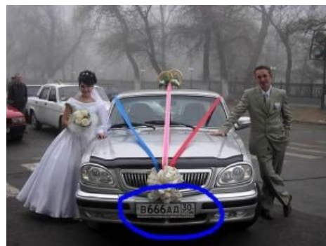
Номер как бы намекает (спойлер: фейк .)

Также в свадебном кортеже почти всегда присутствует автомобиль с кузовом «универсал». За неимением