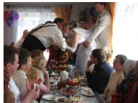
В тесноте да не в обиде накладе

Те, кто пытаются сохранить традиции, но жаба или материальное положение душит, устраивают так называемую «скромную семейную» свадьбу.