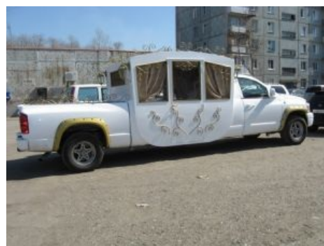
И так бывает...

Bridge flashes Booty in Limo / Невеста показала попу Радостная невеста демонстрирует рабочий орган (после 0:54)