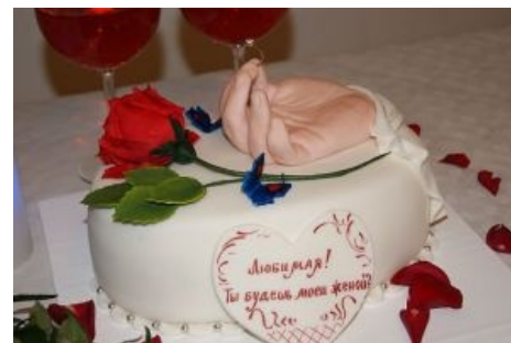
Свадебный торт «Завтрак людоеда»

Окупаемость торта зависит от степени опьянения и правильной организации отъёма денег. Первые 1-3-10 кусков торта уходят по правилам аукциона (кто больше дал — того и тапки) по цене сопоставимой с ценой самого торта. Но даже после аукциона остальным гостям кусочки торта достаются не безвозмездно, а за символическую плату в 100—500 рублей в зависимости от жадности новобрачных. (спойлер: Пишите уже регионы, где этот ад происходит!(Краснодарский край, Удмуртия, Карачаево-Черкесия. Инфа 100%)