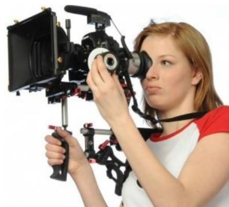
В готовности снимать видео

Чем привлекателен фотоаппарат в плане съёмки видео? Тем что при цене довольно низкой и доступной , даёт тебе возможность снимать видео: 1) максимального разрешения; 2) с прогрессивной развёрткой; 3) высококачественной СМЕННОЙ оптикой; 4) с матрицей большого размера, обеспечивающей высокую светочувствительность, малый ГРИП и т. д. — и всё это по цене,