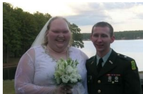
Типичная фотография молодых

Драка на свадьбе Еще один довольно известный пример