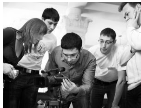
«МК» в вакууме

Программа типичного быдло-МК предусматривает буквально всё: «особенности строения тела человека» (!), «способы создания иллюзии многокамерной съёмки» (актуально!), а также «Работа с молодыми. Как выкачать из них как можно больше денег» и «Постобработка видео: как с помощью быдло-цветообработки создать видимость, что твоё видео — не шаблон, а крутое и продвинутое».