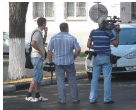
Кого бы снять?