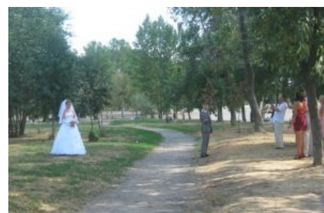
Невеста на ладони. Вид сбоку