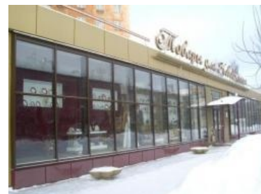
Магазин «Для молодожёнов»