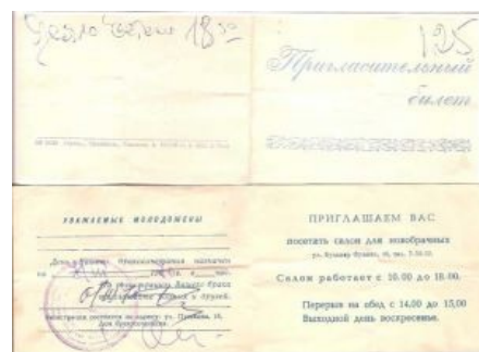
Справка из ЗАГСа