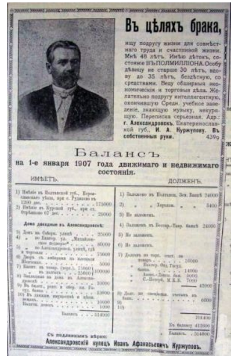
Правильно заполненная анкета. Это единственное, что их действительно интересует.