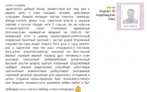
Автобиография типичного обитателя СЗ