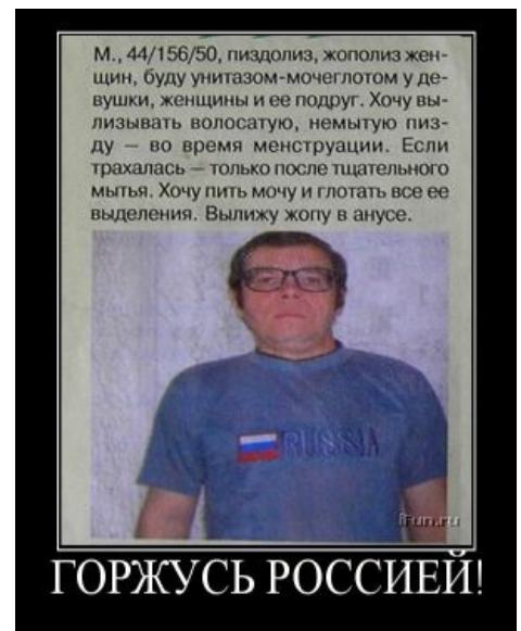
Но бывает и так...