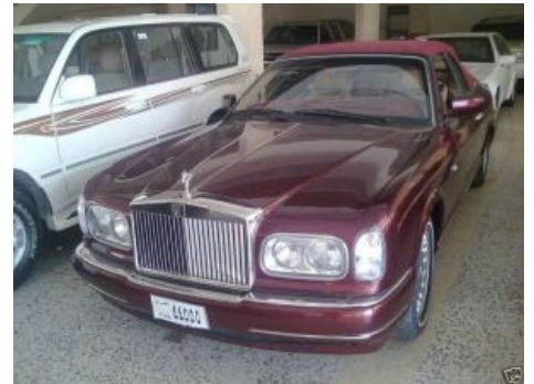
Он наверняка катался без мигалок