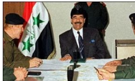
Халабджа? Какая Халабджа?

«Конечно, это всё есть. А как, по-вашему, следует поступать с теми, кто выступает против власти?»