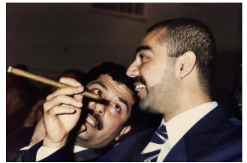
Удею и Кусею глубоко похуй на содержание этого абзаца

После падения режима про спокойную жизнь забыла вся страна. Первым делом демократизаторы снизили налоги для корпораций с 45% до 15% и разрешили вывозить всю прибыль без налогов, что не могло не