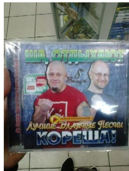
Ша, отдыхают кореша! Гоблин и Кочергин как бы символизируют

Здесь, собственно, две темы: либо крутой мент, который мочит в сортире уголовников, не берёт взяток и вообще всячески блюдёт честь мундира , и насрать ему на то, что жена с тремя детишками сбежала от голода к олигарху, а продажный начальник грозит увольнением. Либо в точности икс в минус первой степени: мент обыкновенный, который взятки берёт, бандитов отпускает и в кустах с радаром сидит, но куда ему деваться, ведь надо же кормить жену с тремя детишками и приبلудившего с ними разорившегося олигарха.