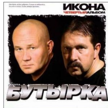
Блатная романтика, усы и ПГМ на одной обложке