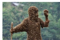
Пчелиный суд: скорый и справедливый.