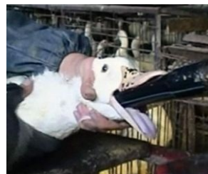
Принудительное кормление гуся

Несмотря на вышеперечисленные недостатки, козы крайне неприхотливы в плане еды, зимой могут спокойно жрать что угодно, от соломы до березовых веточек, а летом достаточно выгнать их в поле или на опушку леса, приставив к ним малолетнего оболтуса, приехавшего на каникулы, в качестве пастуха. А иногда их пасут вообще путем привязывания длинной веревкой к колышку к дому травке. Особого ухода эти животные не требуют, а десяток коз по выходу молока и мяса заменяет корову, но если корова случайно откидывает копыта, то для семьи это беда похлеще смерти какого-нибудь горячо любимого родственника, а одна-две подоших за зиму козы — потеря не такая уж и страшная. Однако, козы очень брезгливы. Они не станут пить воду из грязной поилки, поэтому ведро следует каждый день промывать чистой водой. Если вы бросите козе надкушенное яблоко, она презрительно отвернется, ибо ВОИНАЕТ ЧЕЛОВЕКОМ . Козы