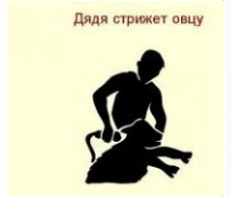
Дядя довит на овцу