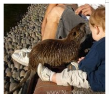
Нутрия и дети.