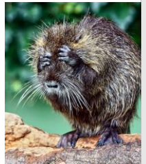
Нутрия в шоке от написанного (чешется).