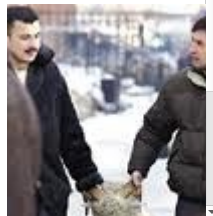
Дядя довит на овцу