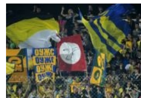
Приём Роберто Карлоса в Ростове

Болельщики ЦСКА снова вывесили расистский баннер