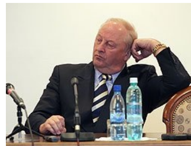
Россель такой Россель

По результатам расследования, проведенного провинциальными оборотнями , причиной аварии, как это ни странно, была названа вышеуказанная яма, из-за которой лопнуло колесо и Россель чуть было не выпилился. И виновника нашли моментально — безвестное «должностное лицо МУ „Октябрьское ДЭУ“». А разгадка одна: перед законом все равны, но некоторые равнее других. Такие дела.