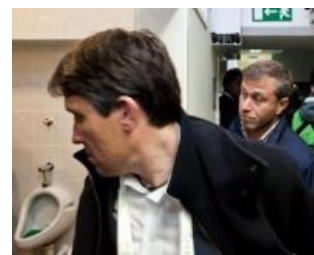
Олигархи тоже какают