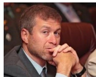
Грустно и с недоумением

Кстати сказать, согласно флюородрозной википидорской статье, простой русский , хм... н-да... еврейский , не ну это перебор, всё-таки он не в Хайфе служил... Словом, простой советский (— о! нормально) солдат на дембельский аккорд продемонстрировал эталонную солдатскую смекалку. Впарил неким местным колхозникам лесные, типа, делянки (нарезанные первоначально, как водится, доблестным срочникам — для дров и