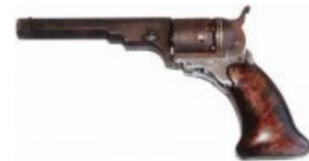
«Паттерсон». Неэстетично, зато дёшево, надёжно и практично.

Револьвер Коллиера. Выглядит даже современной первого «кольтика».