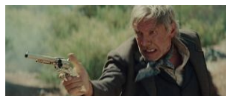
Дональд Трамп Индиана Джонс готовится встречать пришельцев