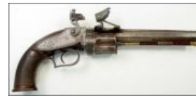
Револьвер Коллиера. Выглядит даже современной первого «кольтика».

Впрочем, первоначальный восторг от их скорострельности со временем утих: хоть шесть выстрелов без перезарядки и казались в то время техническим чудом, совершив их, стрелок ужо на геру медитировать начинал долгую и кропотливую процедуру перезарядки, которую до появления револьверов с возможностью смены барабанов нельзя было ускорить. Бумажный патрон надлежало запрессовать в камору шомполом, а для воспламенения на брандтрубку в торцевой части каморы требовалось нацепить маленький и неподатливый капсюль с гремучим составом — и так шесть раз подряд! При отсутствии готовых патронов порох засыпали из пороховницы, закрывали пыжом, затыкали осаленой пулей и замазывали всё это сверху смесью воска и бараньего жира, так что на зарядку всех камор уходило ( sic! ) до пяти минут . Так