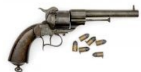
Револьвер Лефошэ и шпилечные патроны к нему