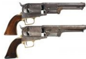
Тот самый Colt Walker — предшественник того самого «Драгуна»

В кино их юзали вообще все, начиная от лихих ковбоев в «Долларовой трилогии» (кроме последнего фильма), продолжая шерифами в