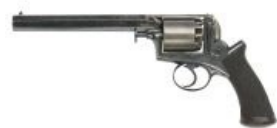
«Адамс». Why so British?

Colt Navy, или «кольт морской». Для моря, как и всё дульнозарядное оружие на чёрном порохе, годился не слишком.