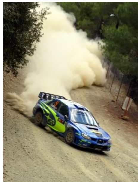
О-о-о-чень мэдлэнный езда

70-е — появление первых монстров: Opel Kadett и Ford Escort. Они были таки заднеприводными, так что пилотировать их на гравии и льду было неиллюзорно сложно, дрифтерам такое и не снилось.