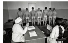
Материал для разделки

Циничное отношение к солдатам и особенно новобранцам существовало давно. До использования пушек в ходу был термин «смазка для мечей».