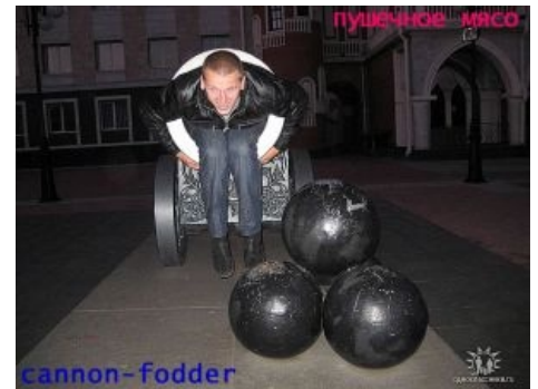
Желающий смазать собой ствол