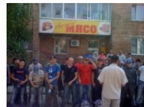
Прямая доставка из военкомата