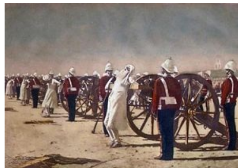
Пушечное мясо по-британски

«Смерть одного человека — это смерть, а смерть двух миллионов — только статистика. »