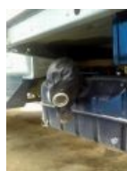
На том самом баке