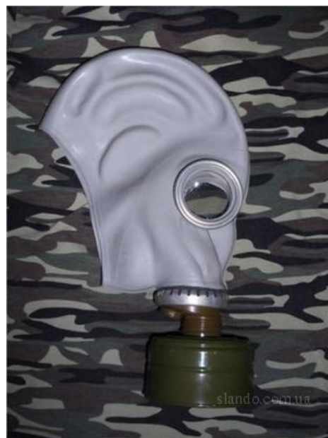
ГП-5. Самый культовый и узнаваемый. Непременный атрибут заброшенных военных частей.