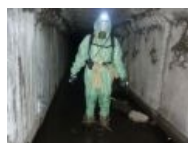
Диггер в говнах