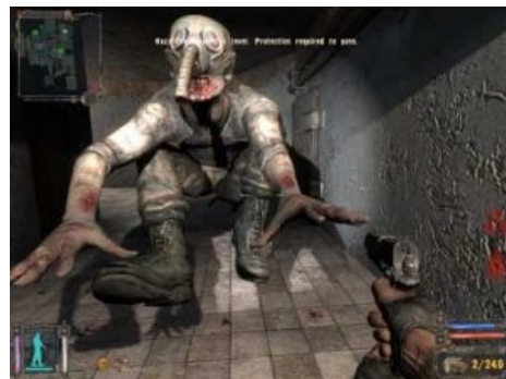
Противогаз ему не помог, зато поможет лечебная доза свинца