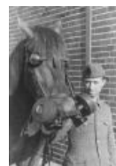
И даже для лошадей