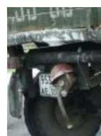
И даже на фаркопе