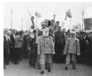
Возрождение кибернетики в СССР. ОБЧР в 1960 году

Но факты-фактики вызывают у жертв антисоветской пропаганды и пещерного антикоммунизма когнитивный диссонанс . Например, в том же роковом 1948 году, когда возродился термин «кибернетика», Михаил Лаврентьев, будущий основатель отделения наук в Золотой Долине в жопе мира , написал на имя САМОго докладную записку, мол, нелишне бы построить в СССР счётную машину. ЧСХ, Сталин отнёсся благосклонно, и проект БЭСМ стартовал. Моделька, МЭСМ , ВНЕЗАПНО оказалась первым компьютером в континентальной Европе.