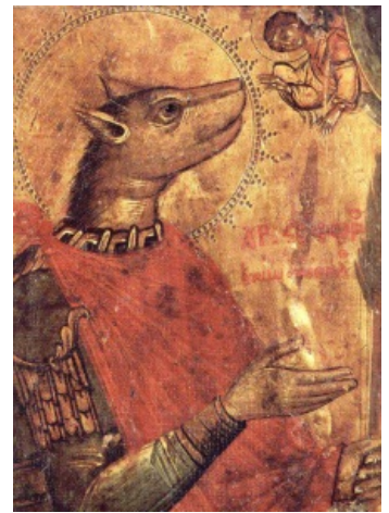
Каноничная православная икона

Если коротко: армянский и греческий патриархи входят в Гроб Г-сподень, в Кувуклию с закрытой лампадой в руке. А выходят уже с зажжённой, на радость толпе молодых верующих .