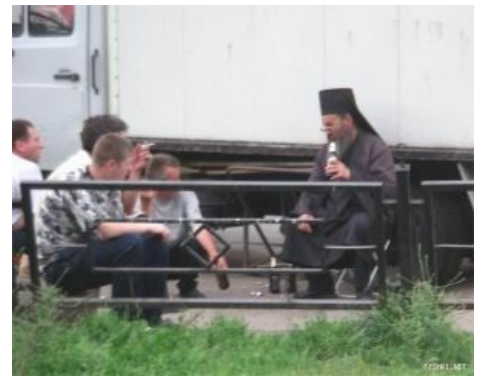
Пиво — это православно!