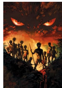
Главное — не смотреть в глаза

Спасение в лице взрослых прибывает как раз в тот момент, когда остров уже почти сгорел, а Ральфа собираются убить и насадить его голову на палку.