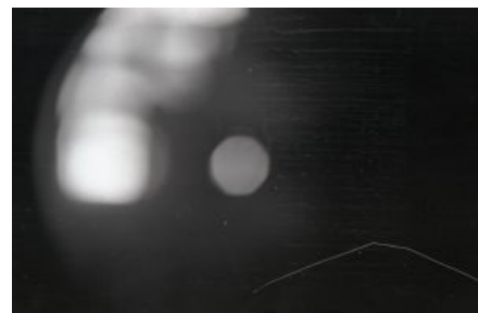
Тот самый кадр