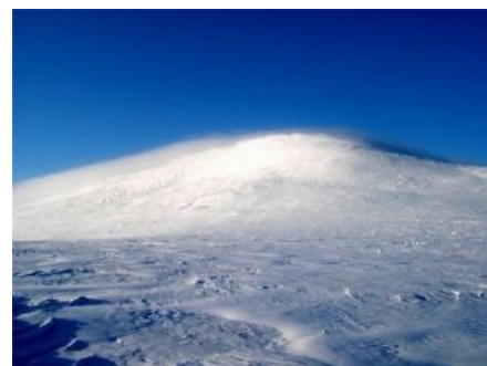
Холатчахль. Безблагодатность как она есть

Истина же слишком кошмарна, чтобы ее можно было поведать простым людям.