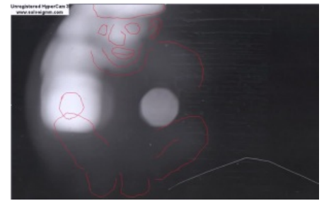
Фантазии юного художника