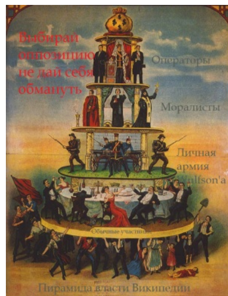
Пирамида власти в педивикии

«Ну да, цензурировать ЛС ушедших из проекта участников мы можем, а заставить спамера переименоваться, оказывается, нет. Блокировать системных POV-пушеров, профессиональных троллей, религиозных фанатиков и клинических идиотов мы тоже не спешим, зато стоит нормальному участнику назвать подобного индивида мерзавцем или ненормальным (не погрешив против истины при этом), резвые админы выстроятся в очередь с банхаммерами наперевес. Заповедник гоблинов. »