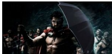
300 Спартанцев ну оочень пафосны.