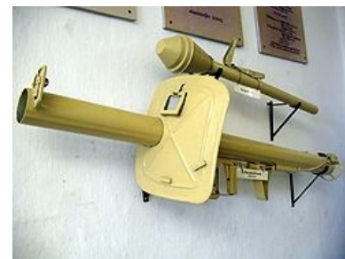
Шрек и фауст.

Смелая попытка арийцев сделать первый ПЗРК аж в 1945-м (!), стрелять предполагалось по медленно и низко летящим целям, но полнейший фейл заключался в том, что цели летать низко и медленно отказывались наотрез и упреждение выбрать в таких условиях просто не представлялось возможным, ни о