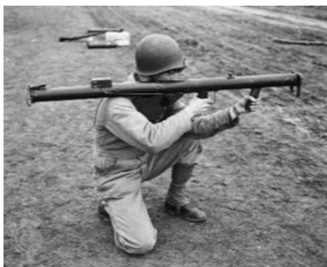
базука несет демократию

Американский расовый реактивный гранатомет. Впоследствии этим именем школата называла все калиберные реактивные гранатометы. Граната таки имеет реактивный двигатель, который разгоняет ее во время движения в трубе. Из трубы она вылетает и летит дальше уже по инерции, поэтому щитка и других защитных приспособлений не требует. Базука превосходила панцерфауст по дальности, уступала по бронепробиваемости. После войны пиндосами была запилена хтоническая «Супер Базука», пуляющая ракетами калибра 88 мм на расстояние до 450 метров.