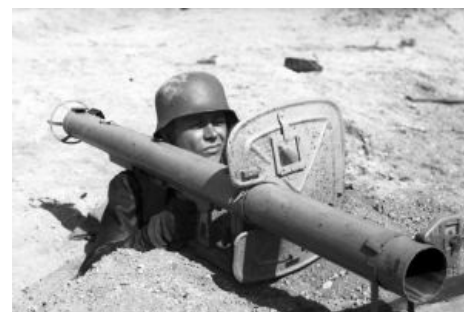
Танки грязи не боятся?