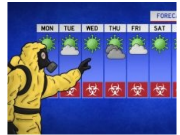
Прогноз погоды: коронавирус.

Вирус из Мексики. На момент написания статьи там и в США от вируса уже трагически склеило лапы Нное количество человек.