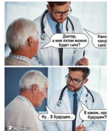
Искренне ваш, доктор Жопоголик .