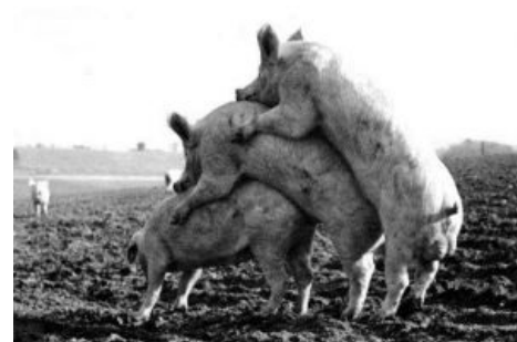
Свиный грипп. Опасайся его!

Кэп утверждает , что старый добрый проверенный грипп на данный момент ликвидирует население гораздо эффективнее (~0.5kk/y), чем все эти новые штаммы. А дядям из телевизора тоже надо кушать. И дядям из фармацевтических компаний тоже. Ежедневные вести-е нелей рассказы про кризис никого не интересуют, а говорить что-то надо. Тем не менее, вирус таки претендует на мировую пандемию и косит быдло на полпроцента эффективнее. Не чума, но сойдёт. Троекратное ура.