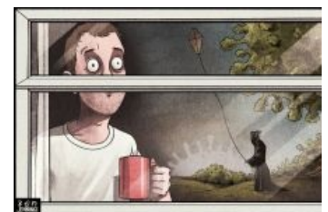
Безудержное летнее веселье.