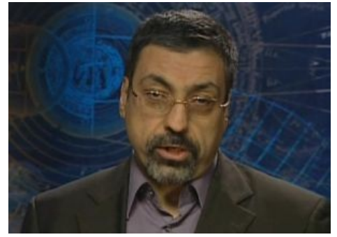
Глоба в говно

в 2002 г. масштабной войны не будет: «будет, скорее, демонстрация военной мощи. В этом году США вряд ли обрушат удар большой силы. Конечно, никто им бен Ладена не выдаст. С этим человеком будет связано изменение всей мировой цивилизации. И Усама бен Ладен — не самая главная фигура, появятся ещё три ключевые фигуры. После человека в голубом тюрбане (=Усамы) придёт хромой или человек с искусственной ногой, на протезе... Есть древнее пророчество: „Хромой бес многих объединит“.»