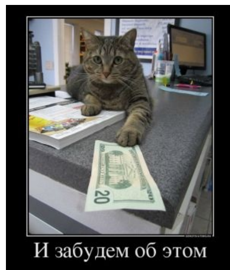
Котэ тоже в теме

С другой стороны, формально законная закупка у заведомо единственного поставщика не обязательно связана с тем, что один из контрагентов занёс другому. Может получиться, что потребитель обязан провести тендер, хотя получить необходимое в принципе может только у одного поставщика. К примеру, в последние несколько лет отечественные учёные вынуждены закупать всё необходимое через систему тендеров. В случае каких-нибудь пробирок, носиков для пипеток и хлорида натрия это имеет смысл, так как продаются они на каждом углу и за пару лет таких закупок представитель института вполне может починить себе дачу. Но есть ещё реактивы для проприетарных приборов, например, секвенаторов. Набор на один запуск 454-Roche GS FLX пару лет назад стоил около полумиллиона рублей и производился исключительно поставщиками прибора. В Россию его поставлял только их же официальный представитель, а закупка левых реактивов или поставка через третьи руки влечёт за собой отмену гарантии на прибор неебической сложности и цены . Отсюда бессмысленный тендер между официальным представителем и тремя ООО Вектор .