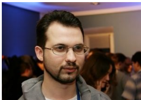
Добрый Байт смотрит на всех как на говно

Это самый большой из всех проектов (на ответах майла зарегистрировано почти 12 млн аккаунтов). Только здесь есть такая абсолютно необходимая функция, как удаление вопросов через SMS .