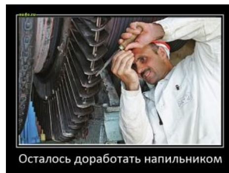
Осталось доработать напильником