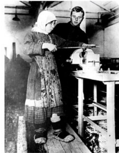
Процесс, как он есть...