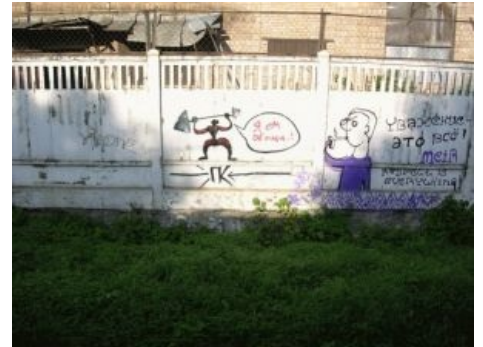
Он ест овощи