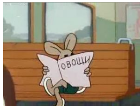
Заяц — первый советский двачер