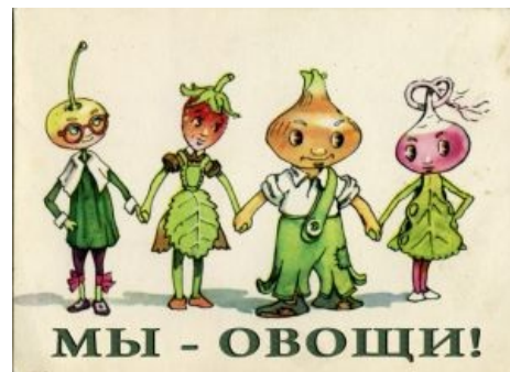
Мы — овощи!