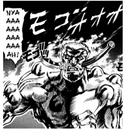
Джек Потрошитель уверяет: НЯ!