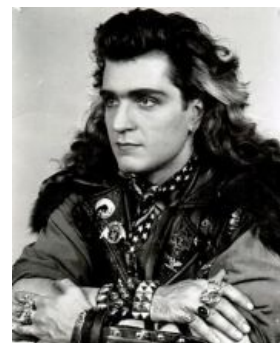
Юный Хирург. Ну няша же!

Летопись славных и не очень дел, составленная в назидание потомкам.