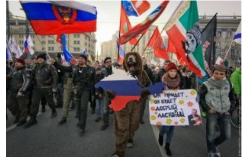
Хирург — искренний сторонник Героя России