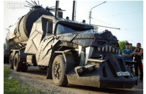
Шушпанцер на базе ЗиЛа 133 — обязательный атрибут тусовки Волков. Горизонт завален.