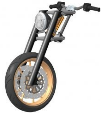
Русский Мотоцикл после 5 лет упорной разработки