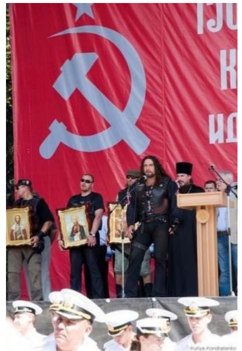
Сферические ВП [2]