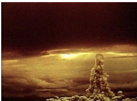
Кузькина мать в профиль.

« Мы вам покажем кузькину мать ». 24 июня 1959 года во время осмотра американской выставки в Сокольниках Хрущёв сказал вице-президенту США Ричарду Никсону: «В нашем распоряжении имеются средства, которые будут иметь для вас тяжкие последствия. Мы вам ещё покажем кузькину мать!» Переводчик в замешательстве перевёл фразу дословно: «Мы вам покажем ещё мать Кузьмы!» Однако, согласно не фольклорно-советской , а американской версии переводчик перевел иносказательно: « We will show you what is what! » Хотя как и в предыдущем случае Хрущ вкладывал в значение этой фразы смысл отличный от общепринятого. По воспоминаниям ближних он подразумевал, что «мы вам покажем то, что вы еще не видели». Переводчики до сих пор фалломорфируют.