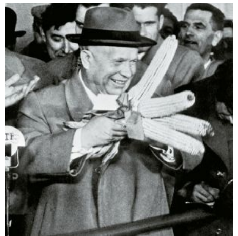
Сабж и всенародные семена МНХ ЧГУ .

Поющая кукуруза (первая реклама в СССР) Человек, похожий на Хрущёва , поёт оду маису