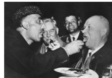
Визит Короля хлопьев в Индию. Взаимное кормление — обычай высшего кашмирского гостеприимства. OM NOM NOM NOM...