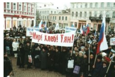
Бабушки нижегородских битардов набижали [2].