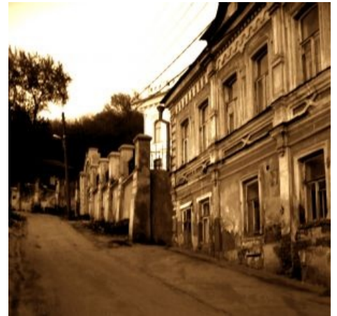
А вот так выглядит историческая часть Нижнего