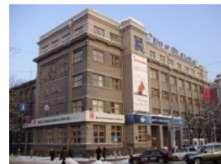
Крепость Сау... Дом Связи

Ещё одной позитивной особенностью (впрочем, малоприятной для жителей Самары , Саратова и Казани, для которых это принципиально важно ) является то, что это село является административным центром, алсо столицей, всего Приволжского сельсовета . Так что посёлок — единственная бумажно задокументированная столица этой части Замкадья. И именно здесь находится центральный офис (не Нижегородский филиал, а именно центральный офис ) Ёбаного ВТ . Для правдоискателей : пл. Максима Горького, Дом связи.