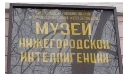
Самый маленький музей в мире.

Пример сюжета. В обычную городскую квартиру вызывают милицию и «скорую» — надо успокоить мужика, допившегося до белой горячки. Съёмочная бригада идет за ними следом. Открывают дверь — в квартире на диване в одних трусах сидит мужик и кричит: «Что вам тут надо? Кто вы такие? Пошли все нахуй из моего дома!». Потом замечает репортера с явно еврейской внешностью и говорит: «Ах, вы из Израиля... Давить русский народ? Так вот вам!» — с этими словами он снимает трусы и выставляет на всеобщее обозрение свое «национальное достояние» (в эфире его, конечно, замазывают blur'ом).