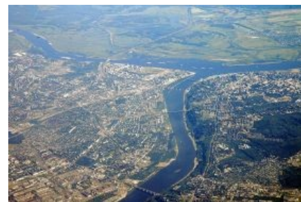
Вид на Нижний Новгород из окна бомбардировщика

Нижний Новгород ( Нижний, Нежный, НиНо, НН, Карман России, третья столица [1] и не Новгород , с 1932 по 1990 год носил символичное название Горький , в честь писателя по фамилии Пешков) — огромная замкадошная деревня на слиянии Оки и Волги, по недоразумению именуемая городом . Немалую его площадь занимают посёлки с названиями «Лапшиха», «Кузнечиха», «Канавино», «Бешенцево», «Гнилицы», «Грабиловка», «Козино», «Молитовка», «Карповка», «Щербинки», тысячи их . Статус города сей колхоз получил сразу с 1221 года. В нём расположено неестественное количество разношерстных заводиков, заводов и заводищей (ГАЗ). Как бы не бомбило у татар, Нижний — столица Приволжья. И это официально. По всей неестественных размеров территории города стоят совковые деревянные халупы для бывших строителей заводов. Управляется силами местного ЕдРа , Шрека и уборщицы бабы Маши. Есть метро и Кремль, что само по себе уже доставляет.