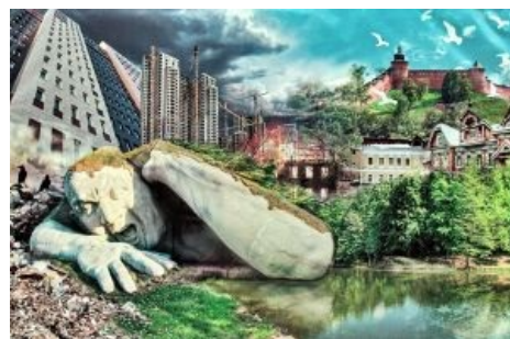
Весь Нижний в одной картинке