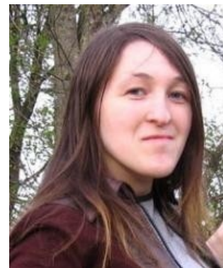
Вот такая она, Бомбистка.