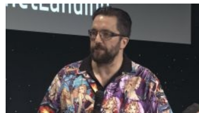
То самое платье Та самая рубашка