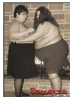
Где же наши принцы????!!11