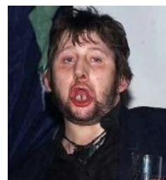
А вот и принц! [1]