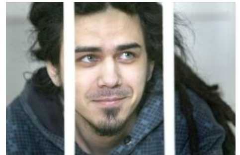
Он утверждает, что всё это придумано без помощи травы. Власти не верят.