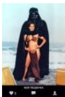
Дарт Вейдер и его дочка