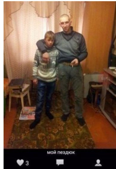
Я и мой пездюк