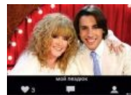
Будь со мной пездюком — или не будь со мной!