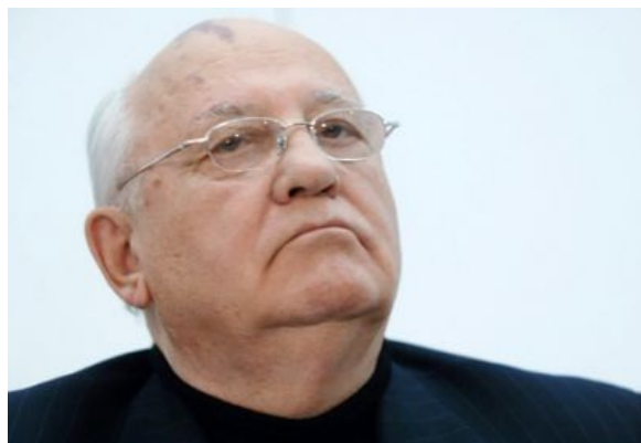
Горбачёв XXI века словно спрашивает: а тебе слабо сделать, как я?