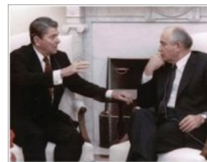
Рейган объясняет Горбачёву, что его страна была pwned by USA

В этом кавардаке только два человека знали что именно они делают: первый это Ельцин, который подписывал, а второй это Бурбулис, который и создал этот хитрый план по устранению Горбачева как президента СССР, чтобы сделать его президентом Ельцина. Эти двое думали, что все вернется уже в новом образовании под властью Ельцина, но не фартануло, не получилось. Если бы у Мишки было хоть немного совести или ума (опционально), и он от переизбытка передал власть Ельцину еще в 1987 на выборах главы партии или во время первых выборов президента СССР, на которых Горби мог честно пойти и проиграть Ельцину, но выбрал аппаратным способом сделать президентом себя, то у Ельцина СССР бы точно не распался. Боря был властолюбивым мудаком , но точно не был политическим импотентом, наоборот, как показали события 1993 года он был способен превратить правительственное здание с парламентом в крематорий ради сохранения власти, да так, что весь мир ему аплодировал.