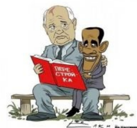
Дядя Миша воспитывает будущего Чёрного Властелина