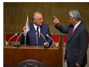
ЕБН шлёт на хуй беднягу Горби

Ельцин - Зиновьев. Памятка для идиотов 2 (О Горбачёве) Зиновьев вангует в 1990